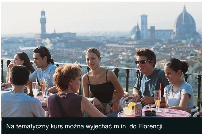
Na tematyczny kurs można wyjechać m.in. do Florencji.

Szkoły językowe z Włoch proponują Polakom naukę m.in. w gaju pomarańczowym, podczas zajęć gotowania włoskich dań czy w trakcie testowania tokańskich win. Czas na takim kursie włosi podzielili na pół, 50 proc. spędzamy na kursie językowym, 50 proc. bawiąc się, leżakując i pijąc, z tym, że jak podkreślają organizatorzy, nawet wtedy się uczyliśmy.